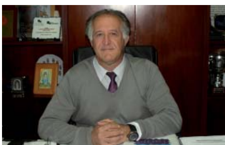
D. JUAN ANDRÉS GIL GARCÍA Alcalde Excmo. Ayuntamiento de Tarifa

realizada, ha permitido la restauración de tres molinos de viento que forman parte del importante patrimonio cultural y etnográfico, no sólo del municipio, sino también de la comarca de la Janda y que de algún modo reflejan el modo de vida y las actividades productivas tradicionales de la zona. Su restauración nos ha permitido su puesta en valor desde el punto de vista turístico y desde el punto de vista cultural y ha permitido que tanto conileños/as como visitantes disfruten de un elemento más que ha escrito parte de nuestra historia y que ahora se incorpora a nuestra oferta turística y cultural”.