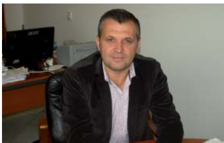
D. JUAN MANUEL BERMÚDEZ ESCÁMEZ Alcalde Excmo. Ayuntamiento de Conil de la Frontera

“La valoración de las actuaciones que se han llevado a cabo en Conil a través del Grupo de Desarrollo Rural del Litoral de la Janda sin duda alguna no puede ser otra que positiva. Hemos conseguido mejorar la calidad de vida de nuestros/as vecinos/as, así como poner en valor el patrimonio monumental y etnográfico de la localidad.